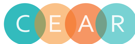
Comité d'Ethique Adef Résidences