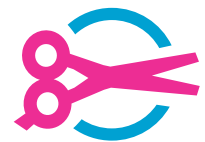
Salon de coiffure