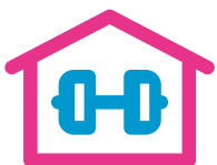
Salle de gymnastique