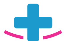
Salle de kiné