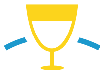
Salon des familles