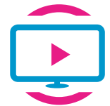
Salons TV et bibliothèques