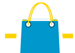
Boutique du Tulipier