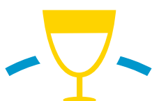
Salon des familles