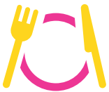
Salles à manger

En dehors de ma chambre, mes espaces de vie et de soins sont nombreux :