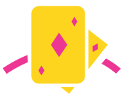
Atelier et salle d'animation